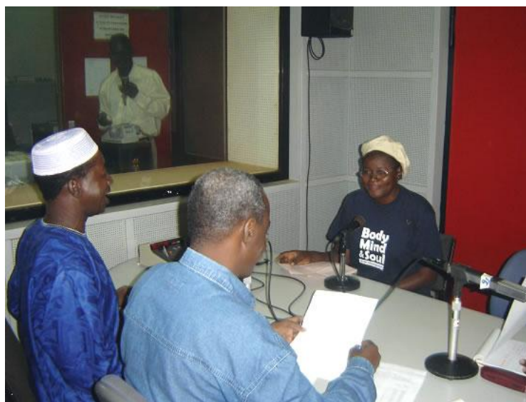
Emission en Fulfuldé