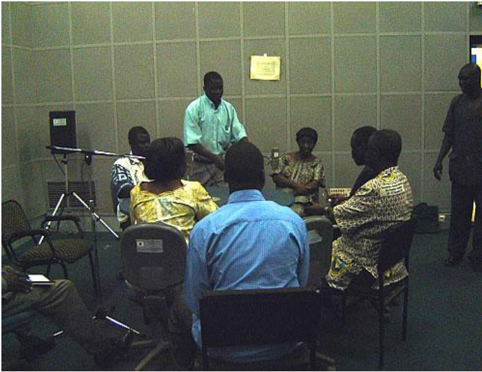
Emission en Français

Les participants ont félicité le WANEP- Burkina pour l'organisation de ces émissions et ont souhaité la multiplication de telles rencontres pour davantage sensibiliser les populations pour la promotion de la paix, gage d'un meilleur développement.