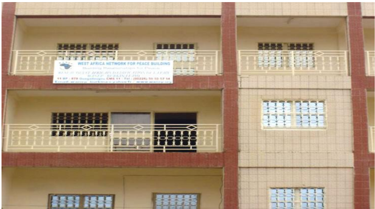
Le Nouveau siège de WANEP Burkina.