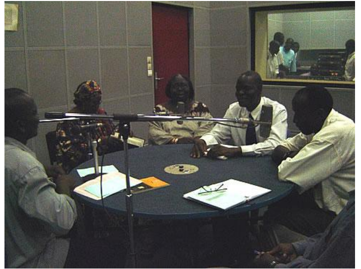
Emission en Mooré