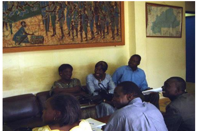
les participants dans le hall